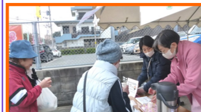
ゴール後の健康コーナー (血管年齢測定と減塩味噌汁試飲)