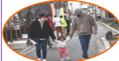
毎年参加すると子どもの成長が楽しみです