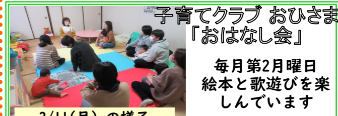
子育てクラブ おひさま「おはなし会」

1階和室をフリースペースとして開放し、たくさんのおもちゃを用意してお待ちしています。