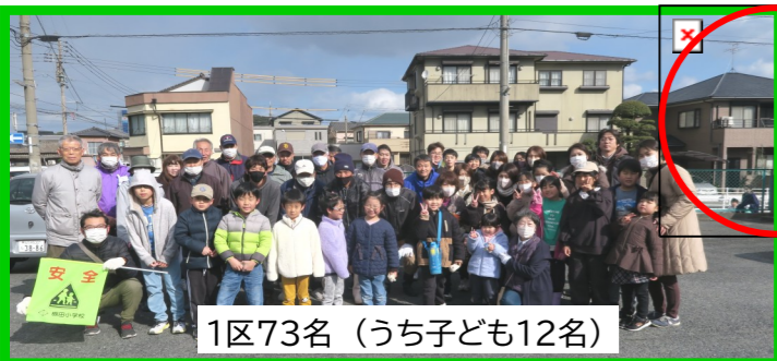
1区73名 (うち子ども12名)

時折小雪が舞う寒い中、今年度最後の槻田川清掃や公園清掃活動お疲れさまでした。(113名参加)