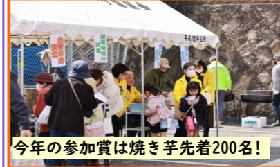
今年の参加賞は焼き芋先着200名!