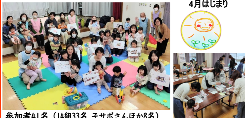
参加者41名 (14組33名 子サポさんほか8名)