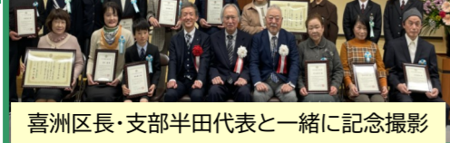
喜洲区長・支部半田代表と一緒に記念撮影

センターまわり4ヶ所の花壇の撫育管理。年3回花の植え替え。現在チューリップが開花中です。皆様に変身して頂いています。