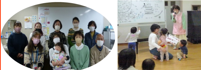
子サポさん!いつも優しく見守っていただき、ありがとうございました