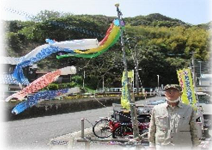
子どもたちの健やかな成長を願って鯉のぼりをあげて下さいました。