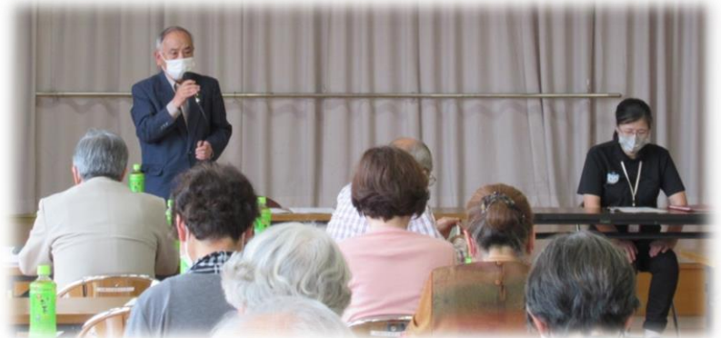
吉田会長、今年もよろしく申し上げます