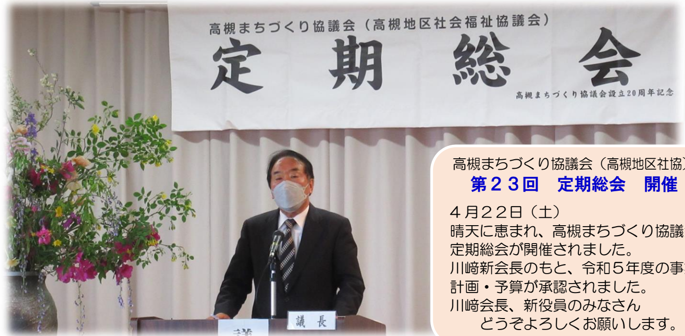
あいさつされる川崎新会長