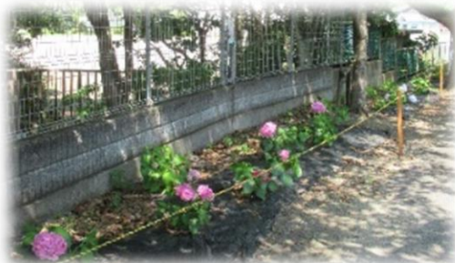
10種類以上! あじさい図鑑みたいですよ