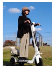
(マイクロモビリティ 試乗体験 当日受付)

「北九州市国家戦略特区」と「東田・未来都市プロジェクト」の関連セミナーを開催します。ワイン特区や特区民泊などの取組の紹介や、体験型イベントも準備していますので是非お立ち寄りください。