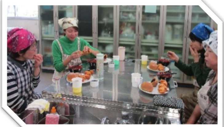
はじめましての皆さんも話しがはずみです