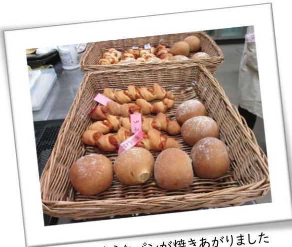
お店のようなパンが焼き上がりました