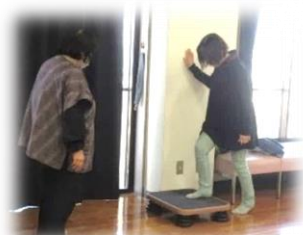
踏み台昇降運動をやってみました。

「緩めてほぐす」「鍛える」を繰り返していくと質の良い筋肉が育つそうです。筋力アップに年齢は関係なし！何か始めてみませんか？