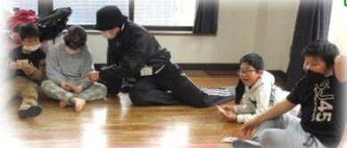
ビンゴ大会。真剣な眼差し！

高校生、大学生のお兄さんお姉さんも手伝いに来てくれて、一緒に交じってもらい、いつもとは少し違う雰囲気の中とても楽しく過ごしました。小森江東小学校として最後の子ども講座は大賑わいでした。