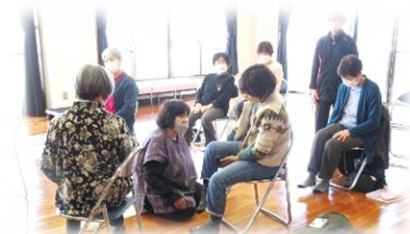
テニスボールを使って固くなった筋肉をほぐしています。