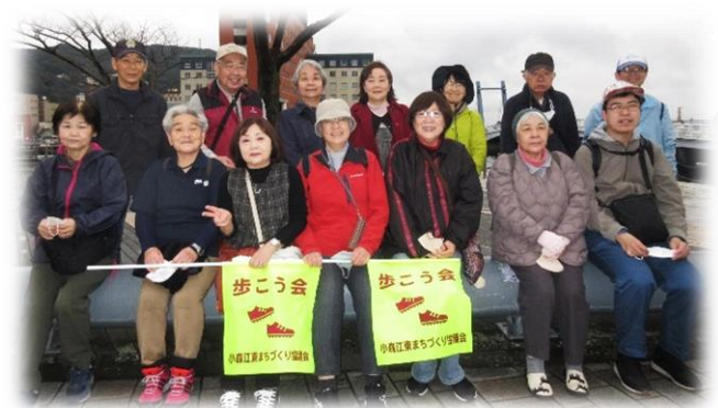
久しぶりにみんなでウォーキング！