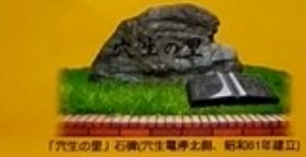
「穴生の里」石蔵(穴生電停北側、昭和61年建立)