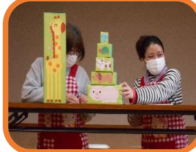
〈はこはこシアター〉