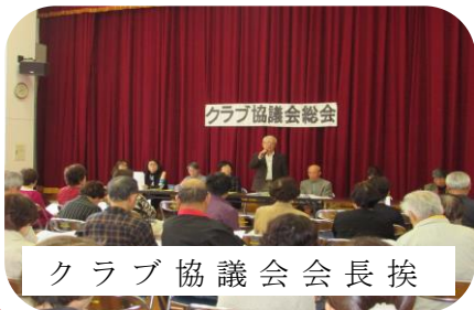
クラブ協議会会長挨拶

平成30年度活動実績・決算・監査報告につづき2019年度の活動計画案・予算案が提示され、質問や意見も活発に出て、みなさんに承認されました。今年度は39のクラブの活動が始まります。