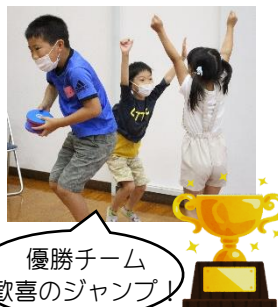
優勝チーム 歓喜のジャンプ!

小石・赤崎校区スポーツ推進委員主催のディスコンを行いました。3~4人に分かれ、チーム名を決めて、トーナメントで戦い、最年少チームがみごと優勝！誰でも参加しやすいニュースポーツの魅力を体験し、子どもたちも「もっとやりたい！」と笑顔で楽しんでいました。