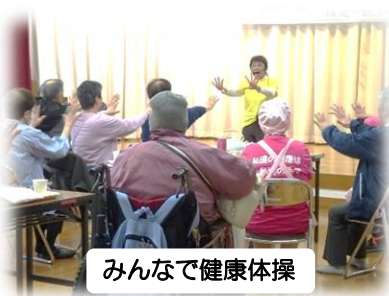
みんなで健康体操

食生活改善推進員さんの作る、栄養バランスの良い食事をいただきながら、参加の皆さんは交流をしています。8月を除く毎月第三水曜日に実施しています。参加を希望される方は枝光南市民センターまで連絡下さい ☎093-682-0067