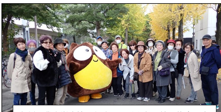
九州工業大学生協のたぬろうくんと一緒に集合写真

11月19日（水）、生涯学習秋冬講座（秋の遠足）で、九州工業大学学生食堂で学生に戻った気分であつて美味しい昼食をいただき、その後は、旧安川邸に出かけ「葉っぱのちぎり絵展」を見学しました。素敵な作品の数々に思わずため息がでる素晴らしい展覧会でした。ちょっぴり寒いウォーキングでしたが良い汗をかき楽しい秋の健康遠足でした。