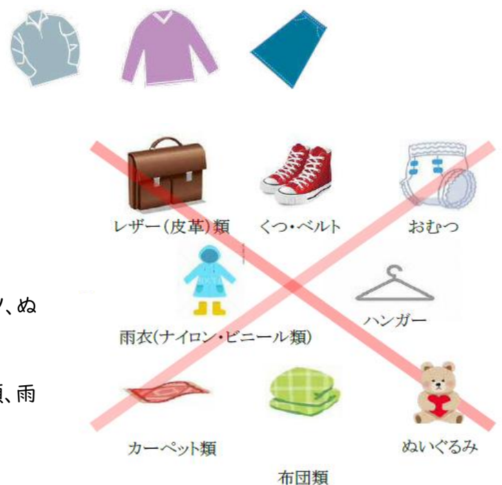
回収できない古着類

レザー（皮革）類、着物、帯、ジャージ、セーター、マフラー等の毛系製品類、雨衣（ナイロン、ビニール類）、タオル類、ダウン、中綿のコート類 等