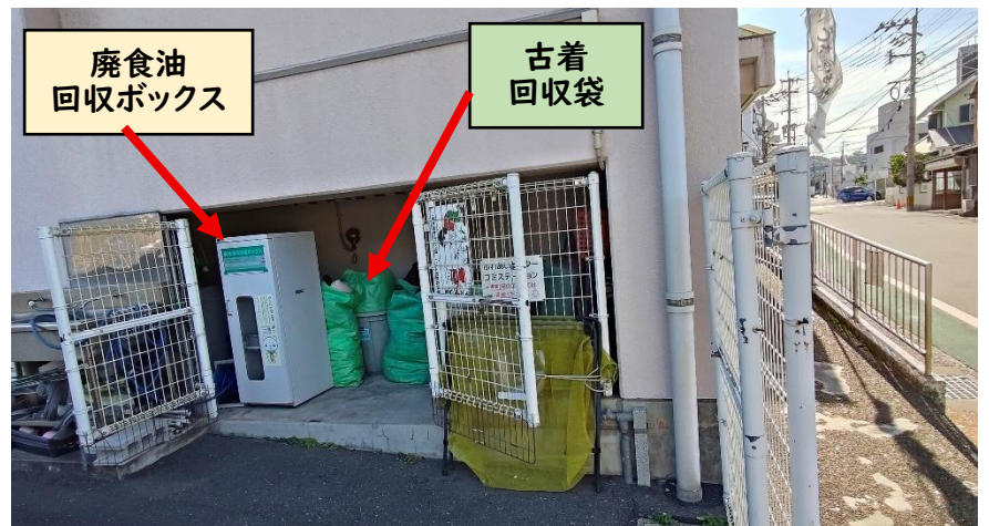
廃食用油、古着の持ち込み場所