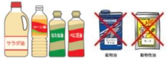
回収できる油の例 回収できない油の例