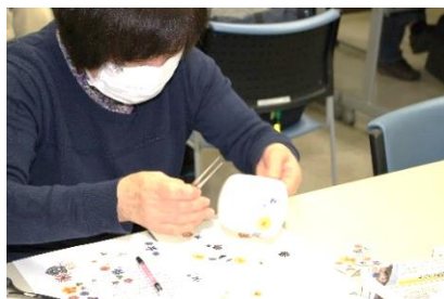
小花を散らしたデザイン♪