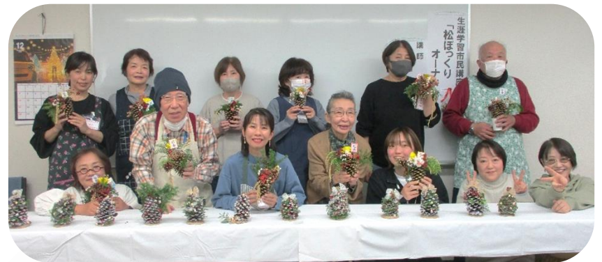
自分の作品を持って、記念撮影♪