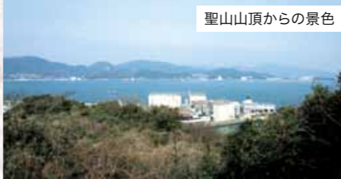
聖山山頂からの景色

西暦200年頃、神巧(じんぐう)皇后(聖なる人)が三韓征伐の折、潮待ちする船団を山頂で指揮したという伝説がある。標高75mの小高い山、聖なる山としてふもとは多数の墓石がまつられている。