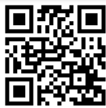
出張フルーター 申込み

地域の方から読み終えた文庫本を寄贈していただきました。まだまだ読んでいただける状態の良い本を無償で提供します。お気に入りの1冊を見つけに来てください！