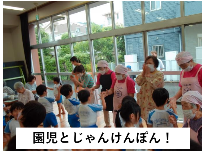
園児とじゃんけんぽん！