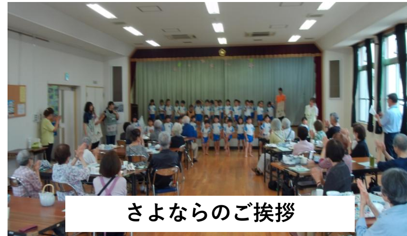
さよならのご挨拶