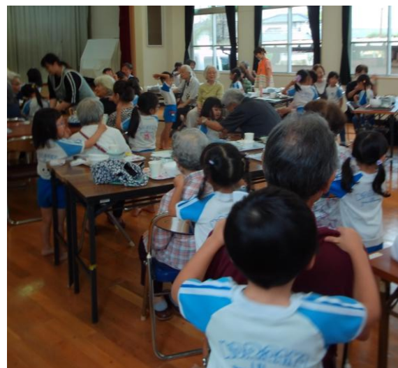
負けたら肩たたき！