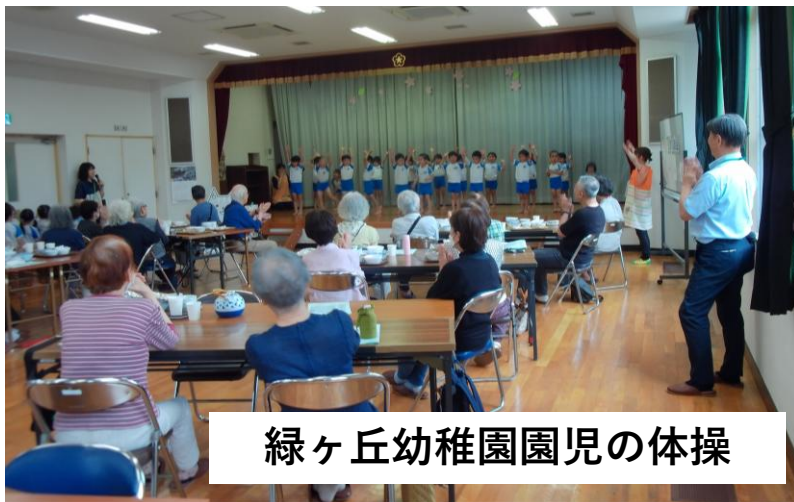
緑ヶ丘幼稚園園児の体操