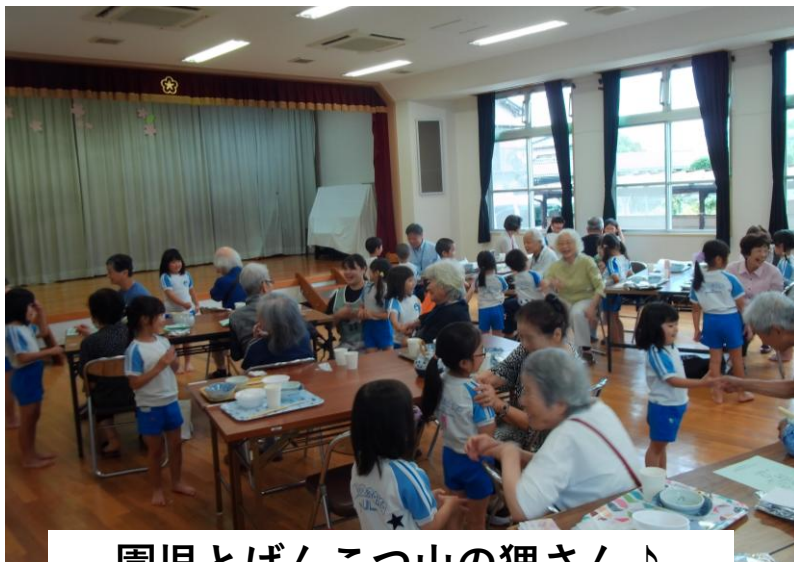
園児とげんこつ山の狸さん♪