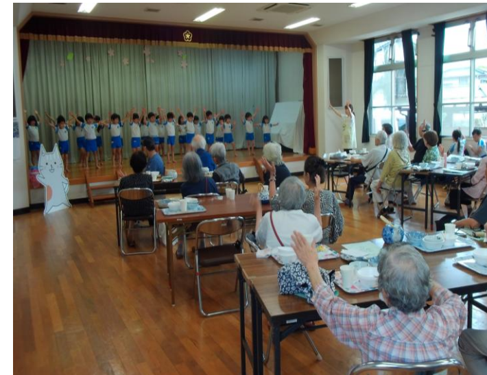
緑ヶ丘幼稚園園児の体操