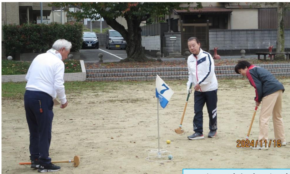
三世代が交流しながら、楽しくプレー！