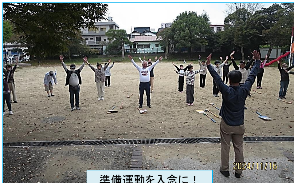
準備運動を入念に！