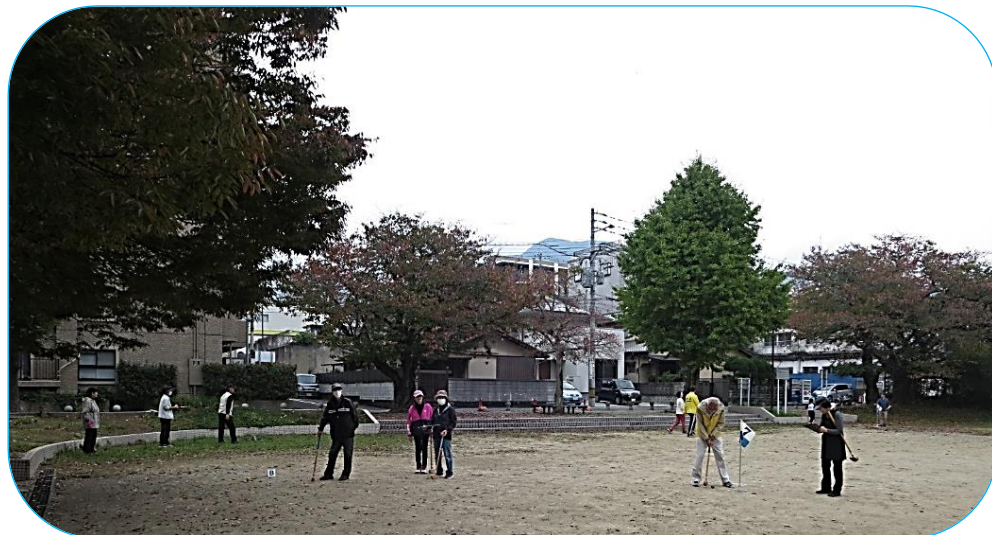
8チームに分かれて、2ゲームを楽しむ！