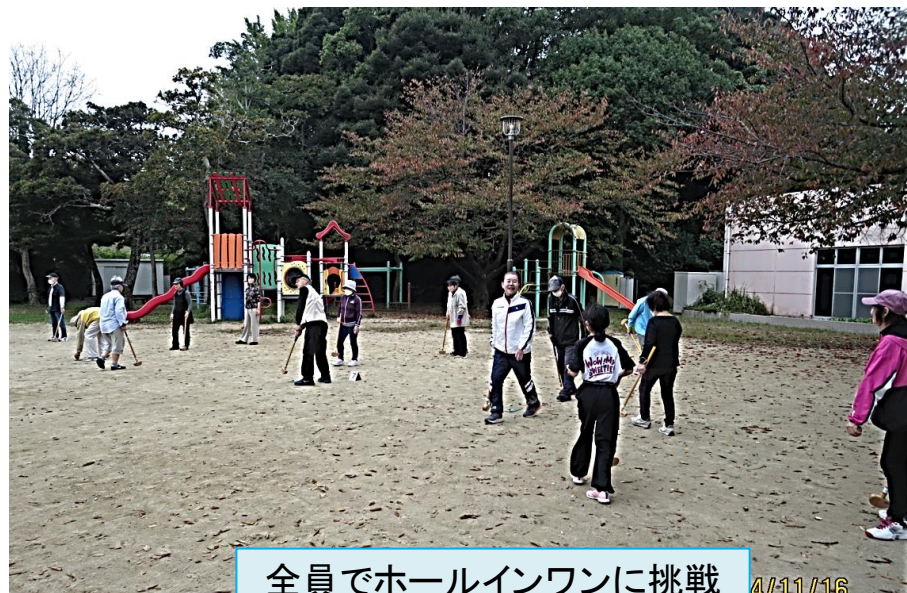
全員でホールインワンに挑戦