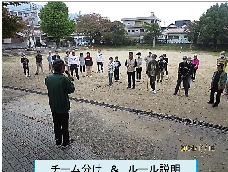
チーム分け & ルール説明