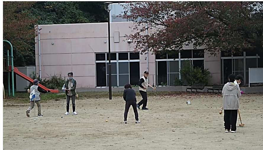
ゲームに没頭する皆様