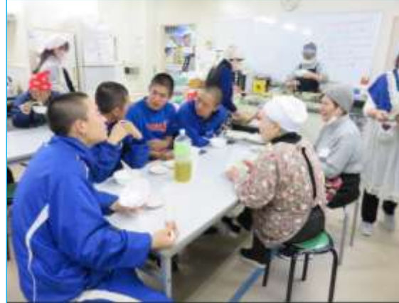
昼食時は高校生と校区の皆様が楽しく歓談！