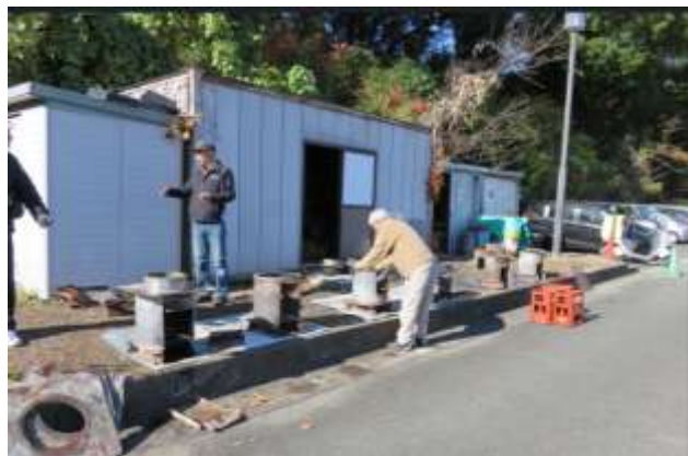
「かまど」は6系列準備 (安定性に細心の注意)