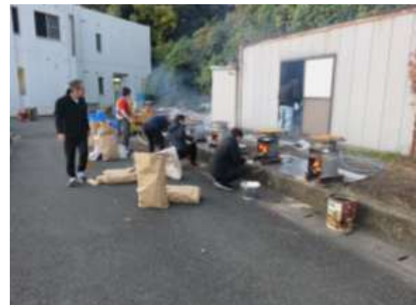
役割分担して手際よく準備は進む！