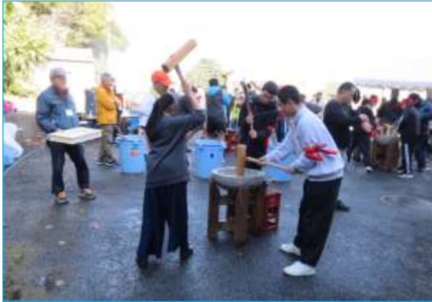
今年も強力な女性助っ人！