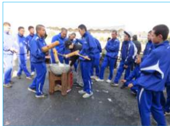
最後まで“餅つき”で腕力を発揮！