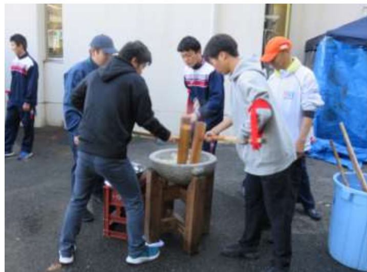
生徒16名 + 引率の先生2名