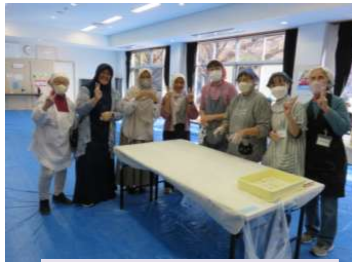
校区の皆様と楽しく歓談！