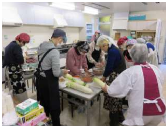
調理室では女性軍が活躍！