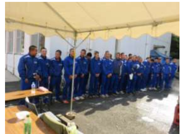
貴重な体験ができたと感謝の挨拶！