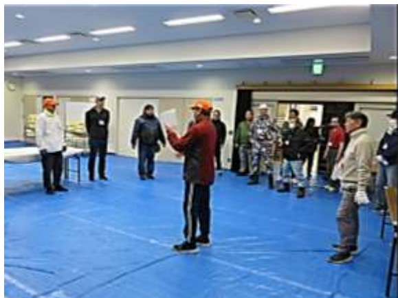
尾石まち協会長が安全に気を付けてと、作業段取りを説明