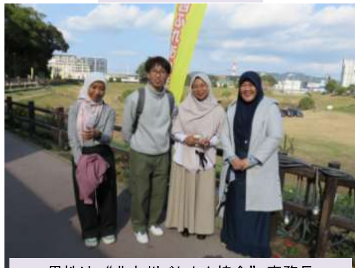
男性は“北九州ベトナム協会”事務長