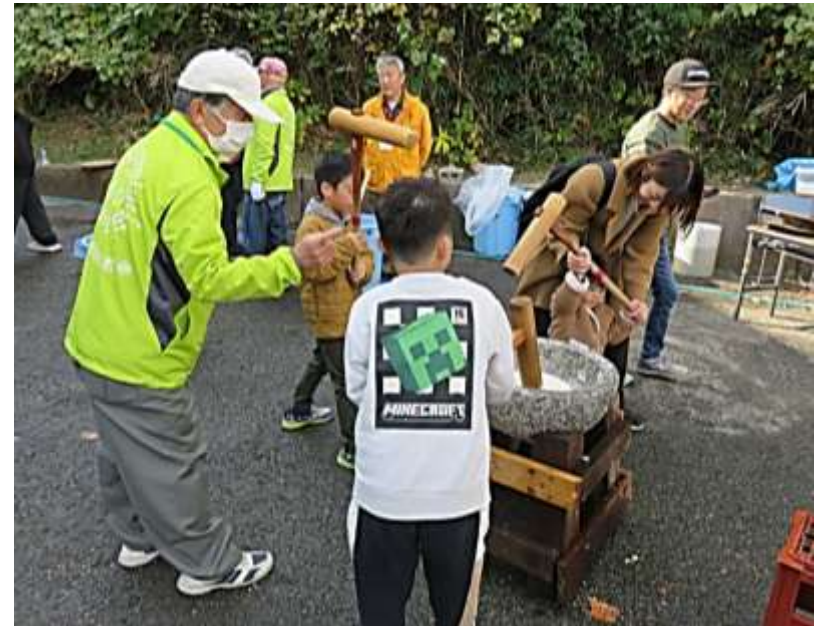
こども “もちつき体験”