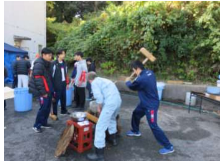
生徒15名 + 引率の先生1名