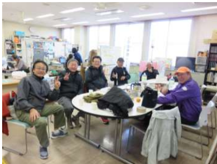
一段落したら和やかに歓談