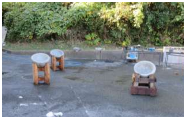
熱湯消毒した3つの臼を準備