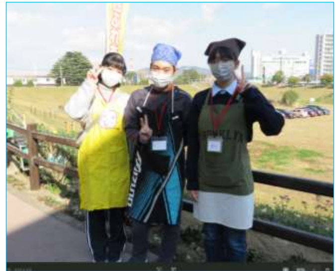
ボランティア部の皆様は年間通して、 各種イベントに協力！