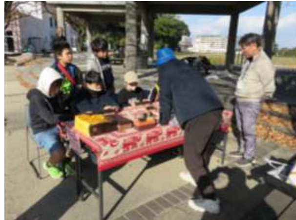
小春日和の中、公園ではゲームに熱中！