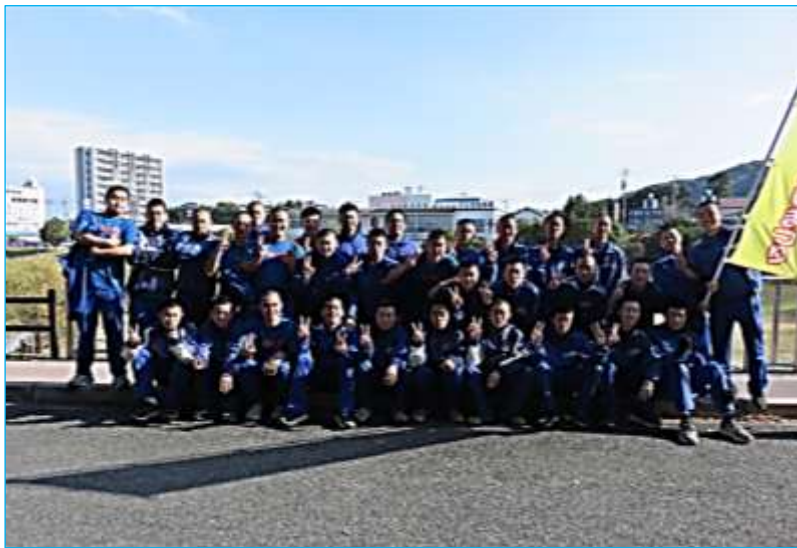
生徒32名 + 引率の先生3名