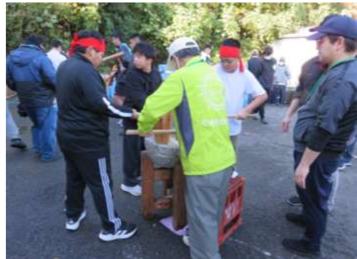
小学生の頃から参加していた子たちもいました！