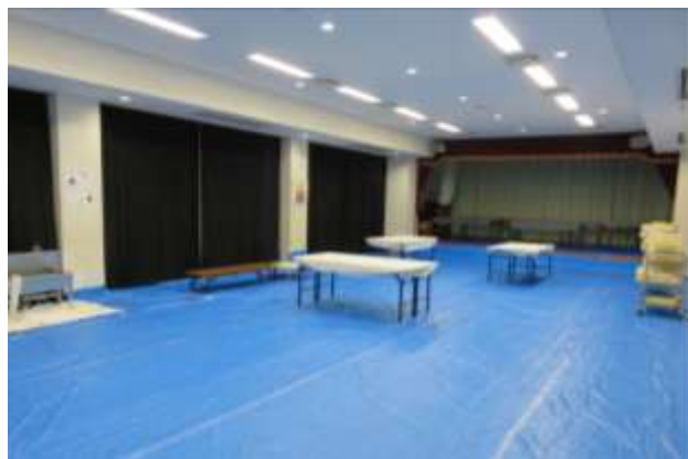
多目的ホール、調理室の床養生