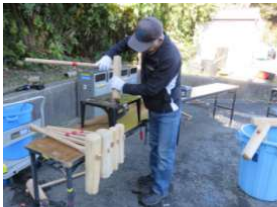
きねを磨きあげる