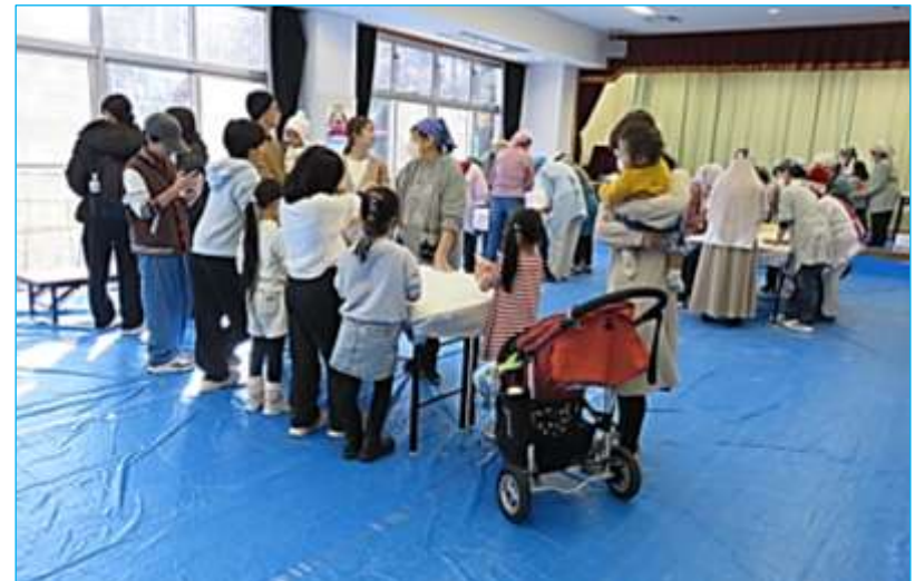
「こども」も「大人」も「もちまるめ」