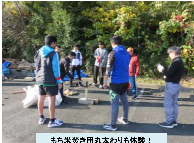
もち米焚き用丸太わりも体験！