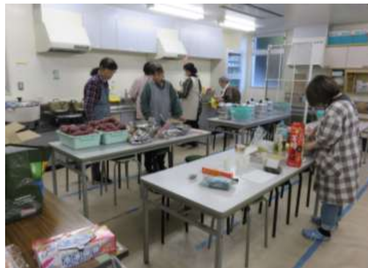
調理室でも準備が進む