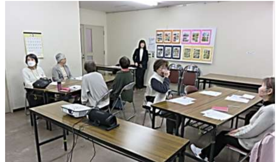
安藤後任館長の挨拶