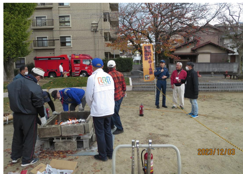
最初に八幡西・消防署員の指導を受ける