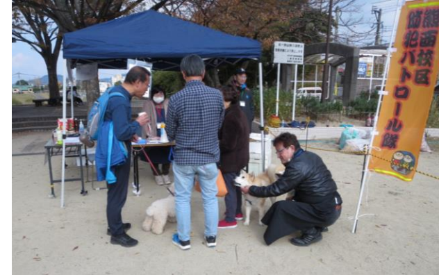
犬と散歩の方も見かけました