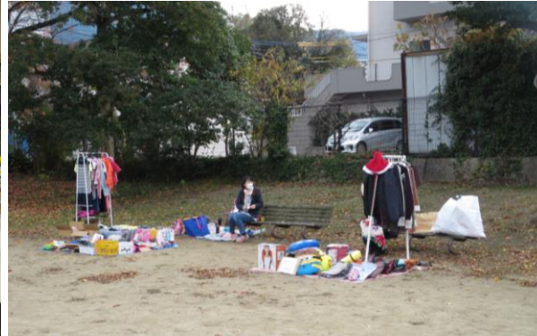
リサイクル・フリーマーケット