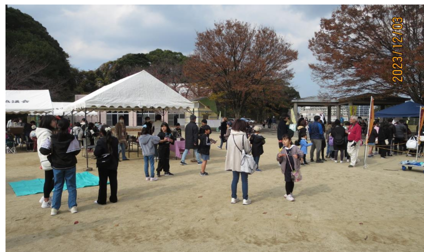
大人たちにも焼きたてのお芋を販売