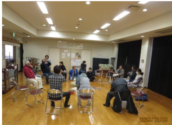
跡片付け後、約25名で反省会 (次世代を担う若者4名も参加)！