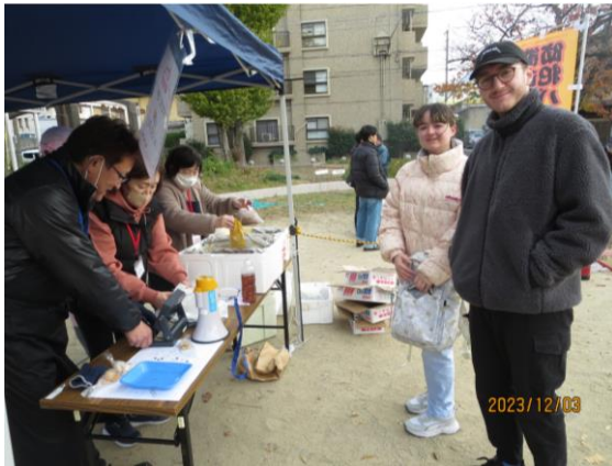
英国人2名も参加(小鷺田在住)