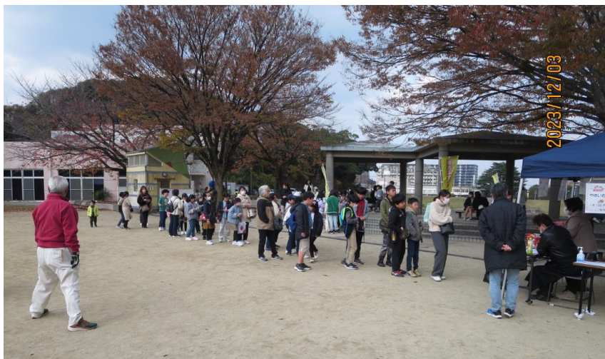
無料のチケットを持っている子どもたちから優先的に配布