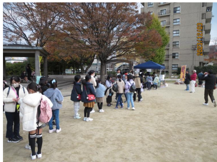
事前に落ち葉を集めてきたこども達には無料のチケットを配布