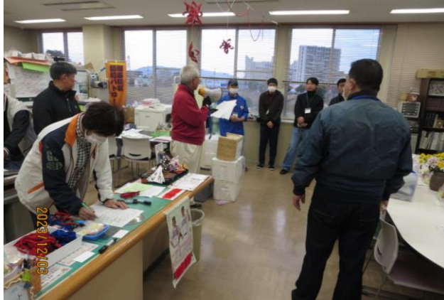
約30名が8:00に集合し設営を開始！ (テント張り、焚き火場)