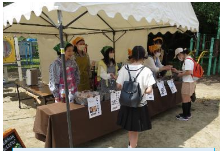
読み聞かせ「たんぽぽ」のお店