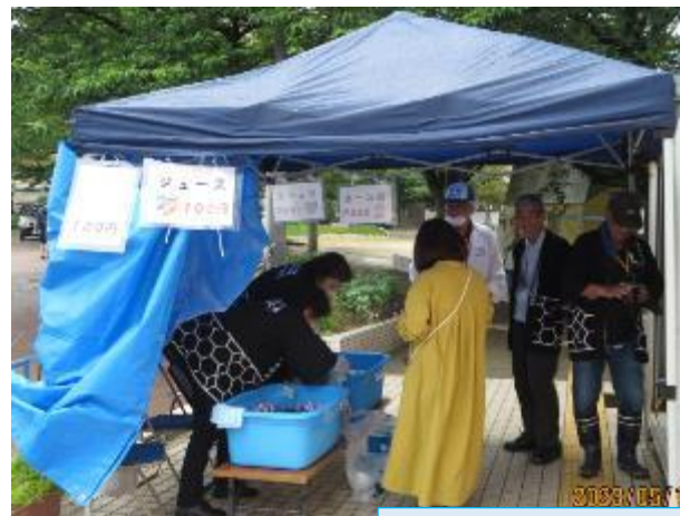
熊西校区まち協のお店