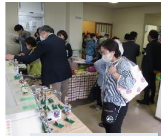
手作り雑貨のお店