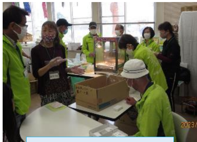
熊西校区社協のお店