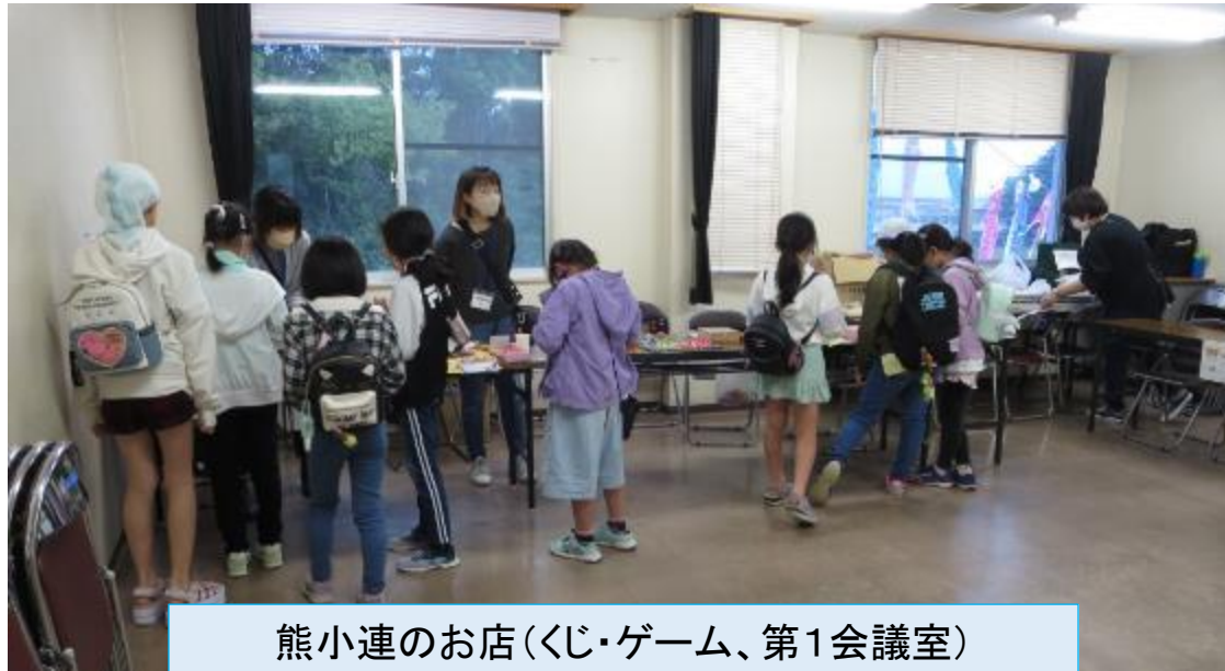
熊小連のお店(くじ・ゲーム、第1会議室)