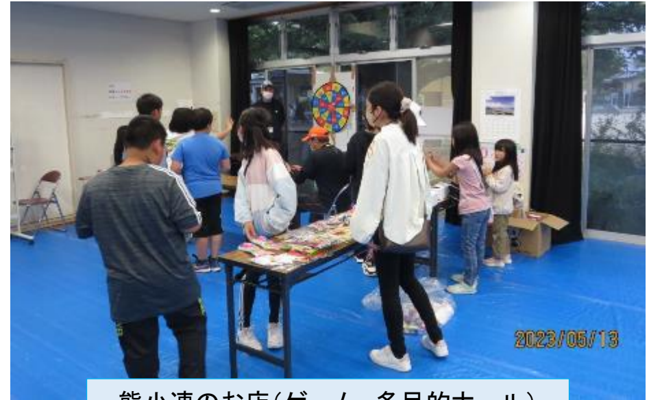
熊小連のお店(ゲーム、多目的ホール)