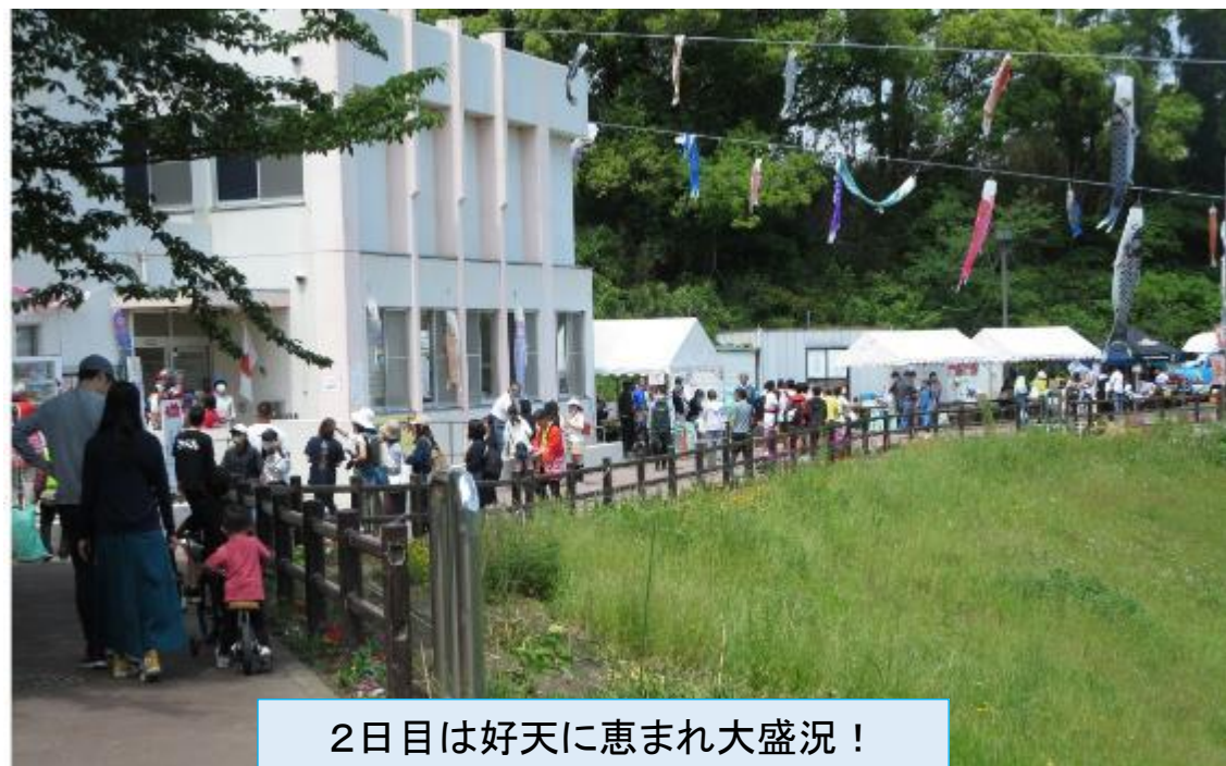
2日目は好天に恵まれ大盛況!