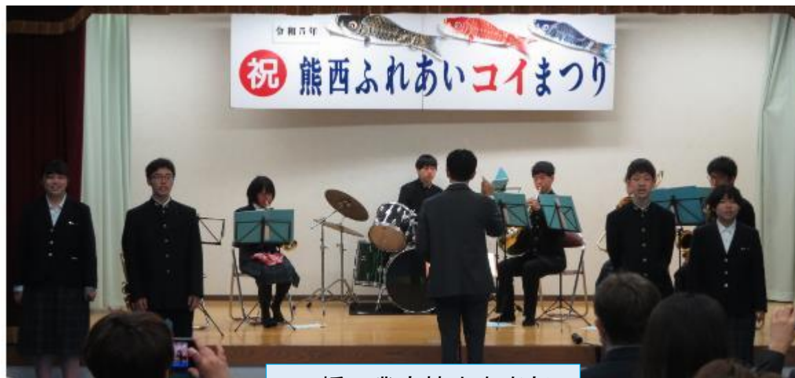
八幡工業高校吹奏楽部

そよ風コンサート in くまにし ~5月13日(土)10:00~12:00 多目的ホール