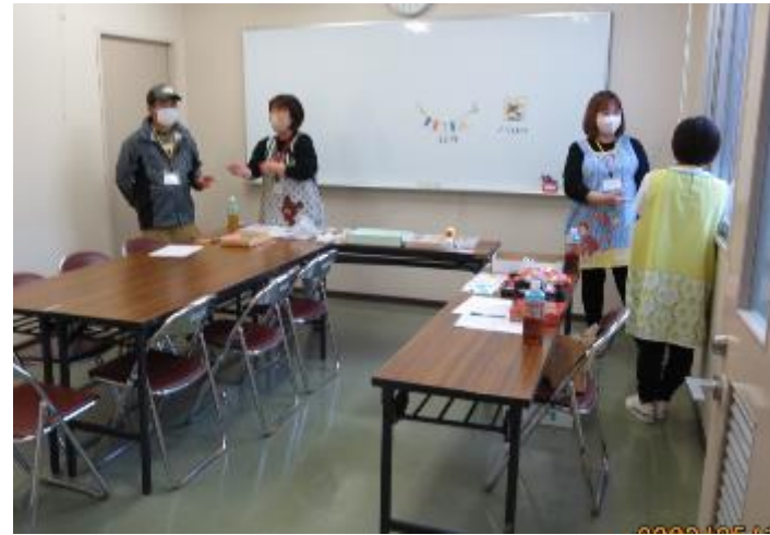
センター・ワークショップのお店(第2会議室)