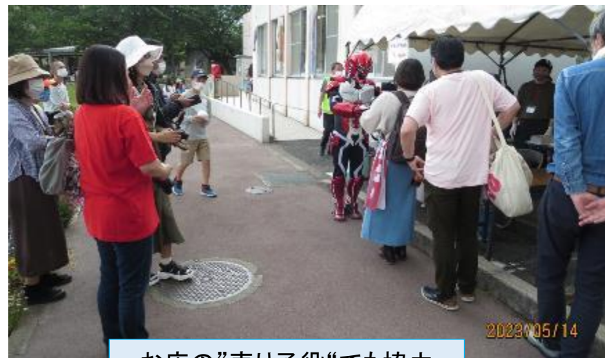
お店の”売り子役”でも協力