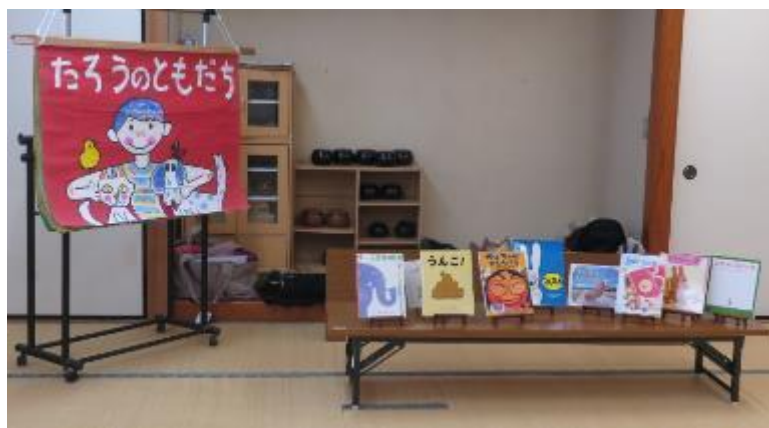
読み聞かせ「たんぽぽ」のお店