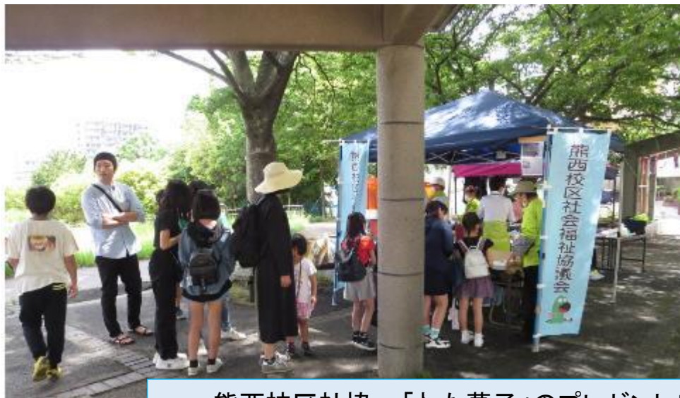
熊西校区社協:「わた菓子」のプレゼント“子ども限定” 前日は「ポップコーン」のサービス