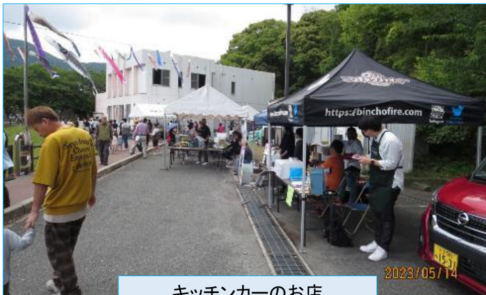
キッチンカーのお店