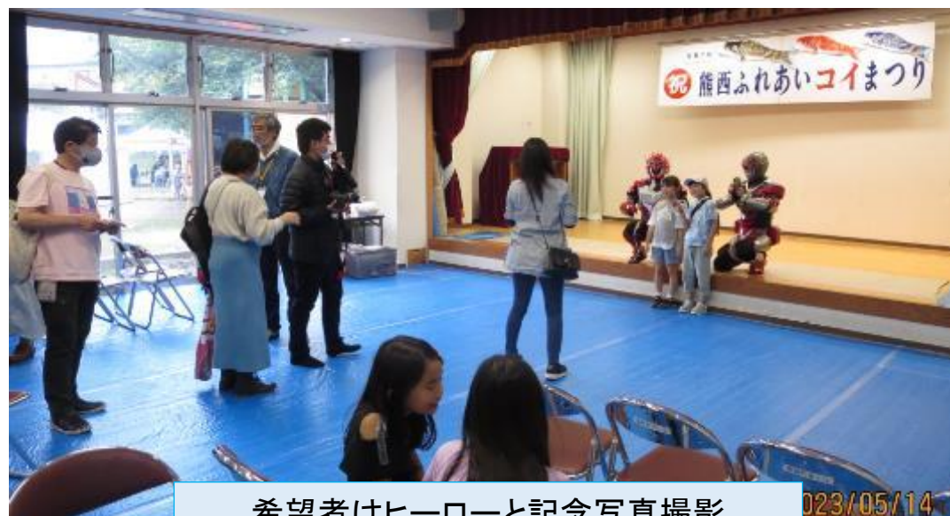
希望者はヒーローと記念写真撮影