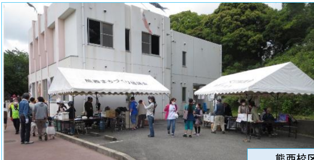
熊西校区まち協のお店