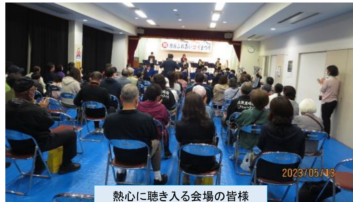
熱心に聴き入る会場の皆様