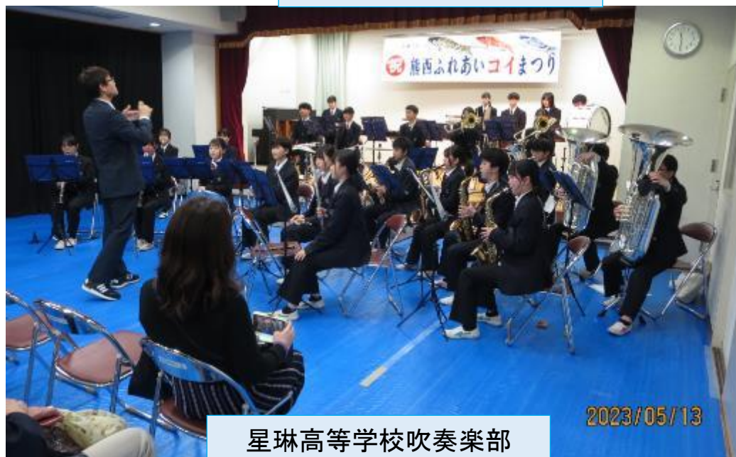
星琳高等学校吹奏楽部