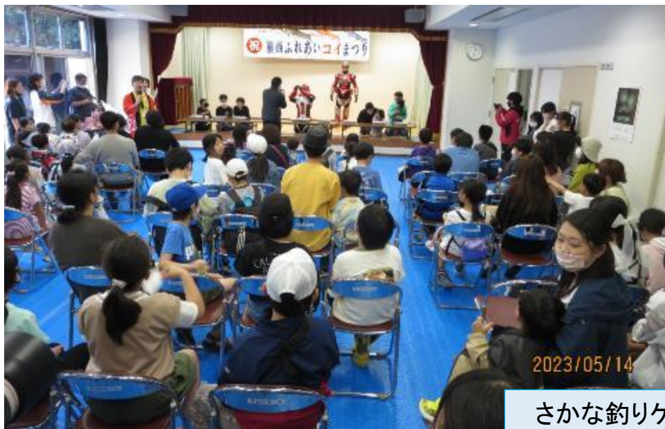
さかな釣りゲームで大変な盛り上がり!