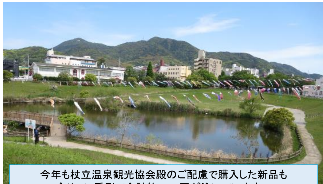
今年も杖立温泉観光協会殿のご配慮で購入した新品も含めて2系列で合計約110匹が泳いでいます!