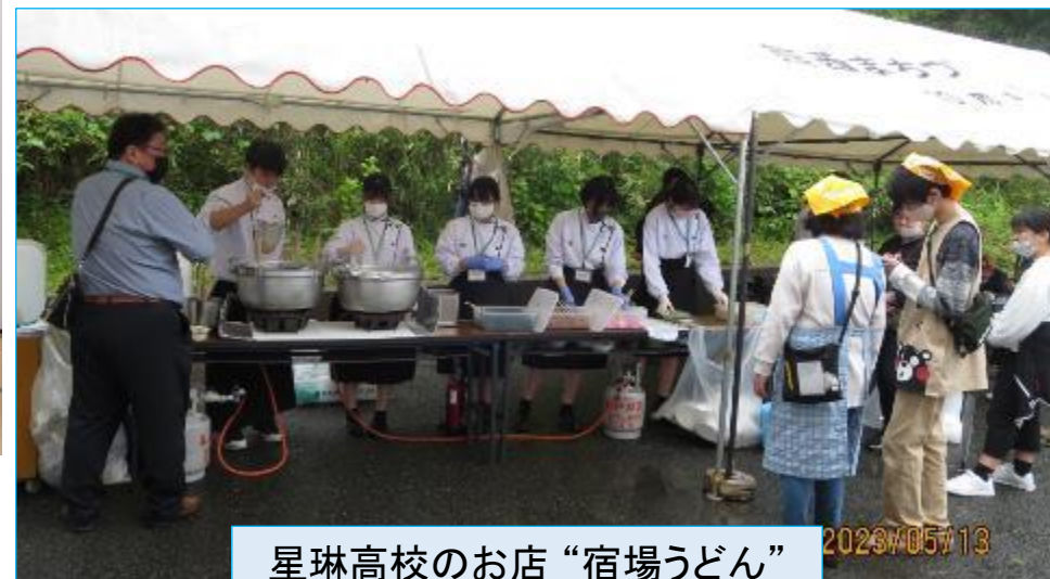
星琳高校のお店“宿場うどん”