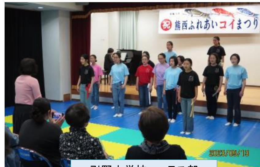
引野中学校コーラス部