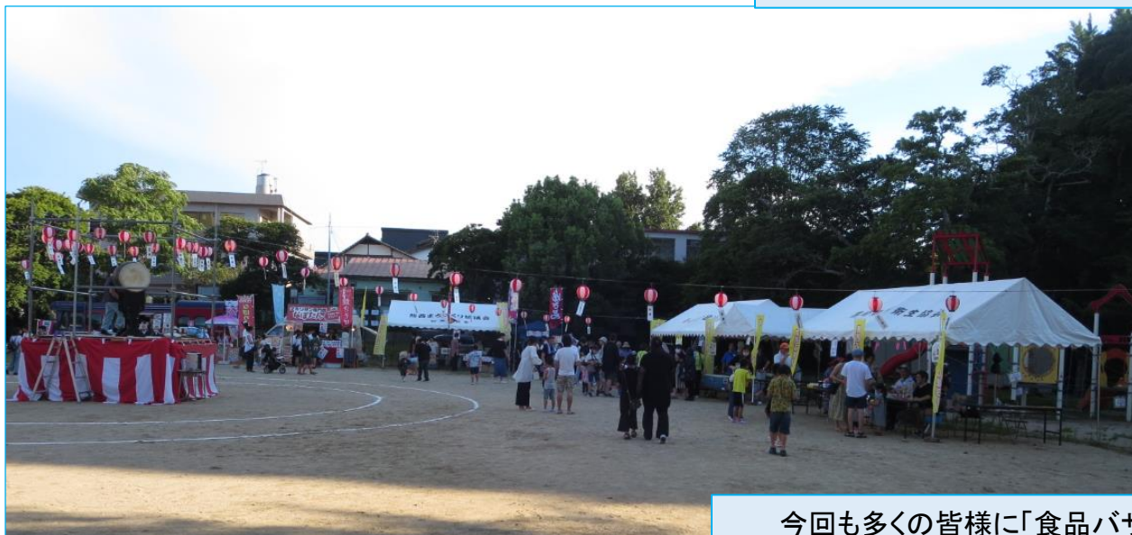
今回も多くの皆様に「食品バザー」でご協力いただきました