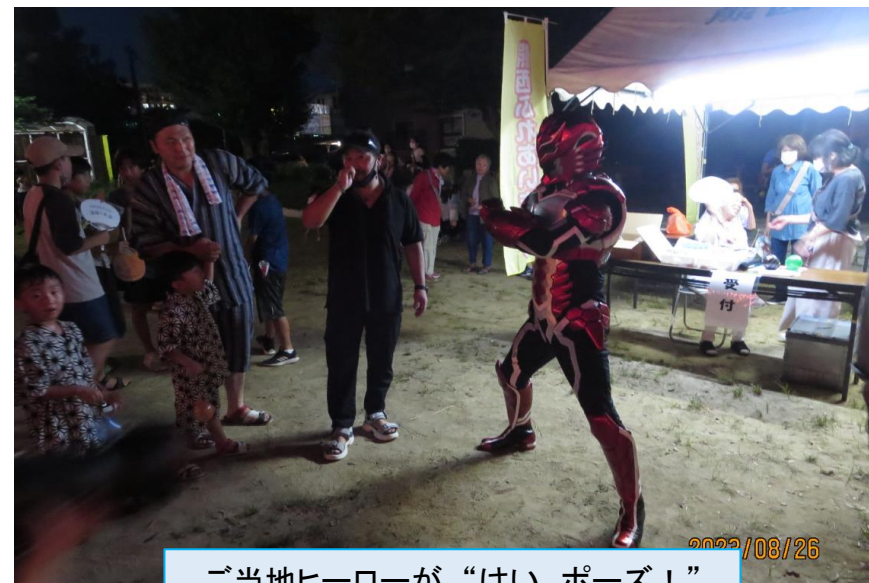
ご当地ヒーローが“はい、ポーズ！”