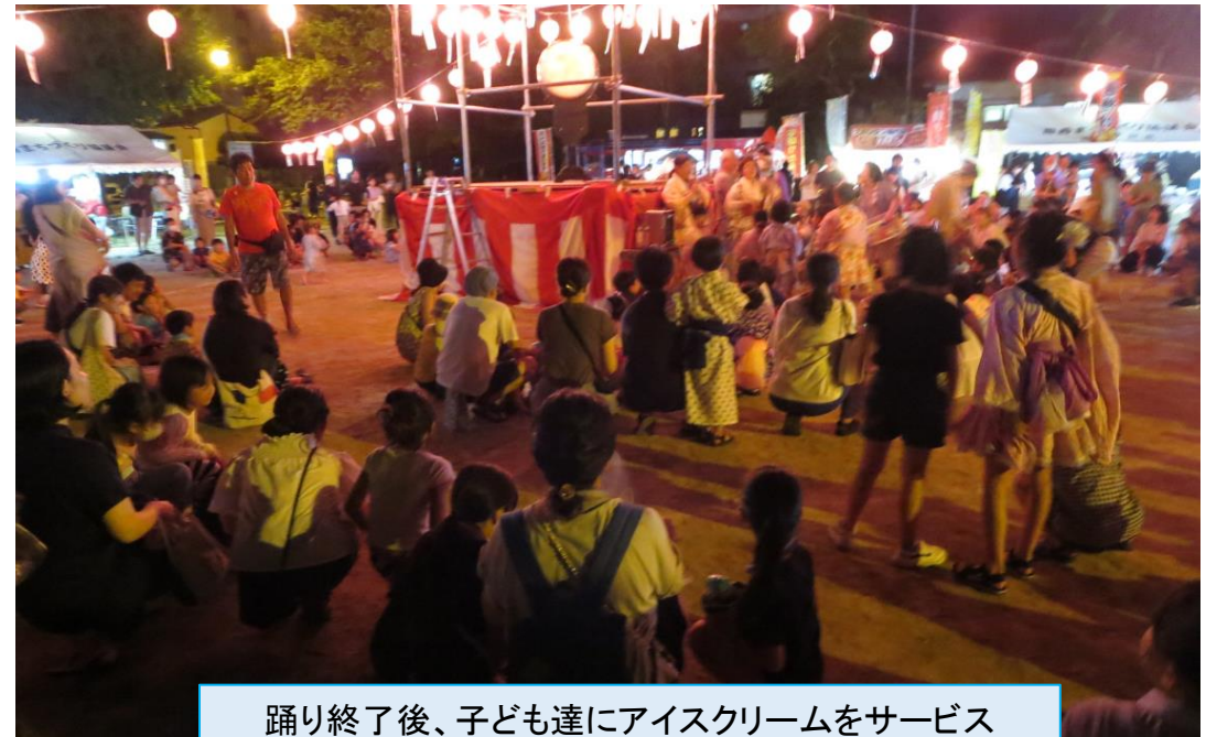
踊り終了後、子ども達にアイスクリームをサービス