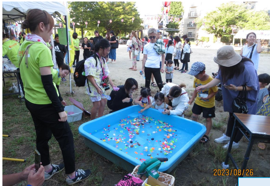
子どもたちはゲームに夢中