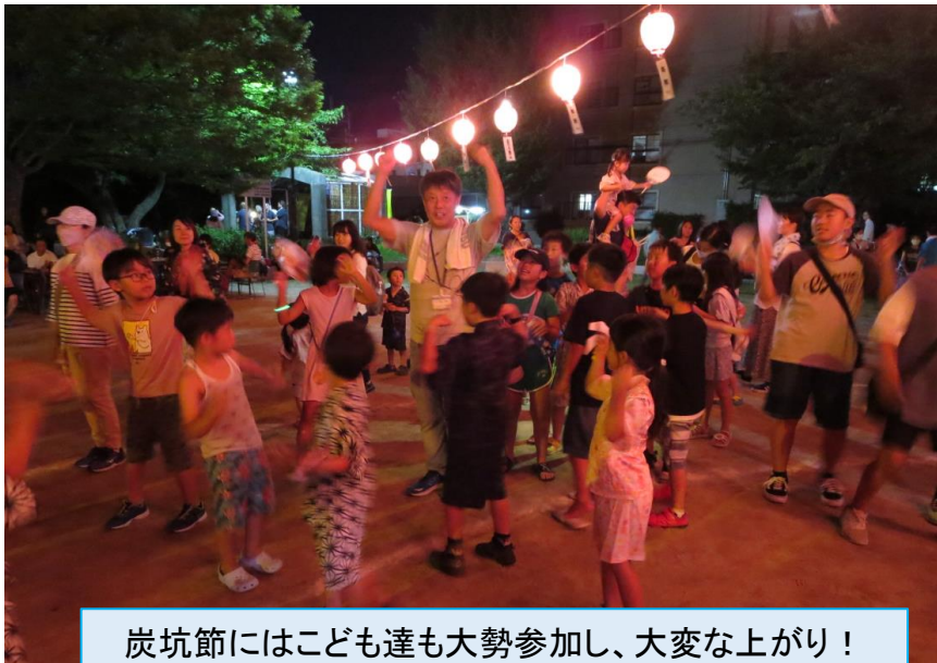
炭坑節にはこども達も大勢参加し、大変な上がり！