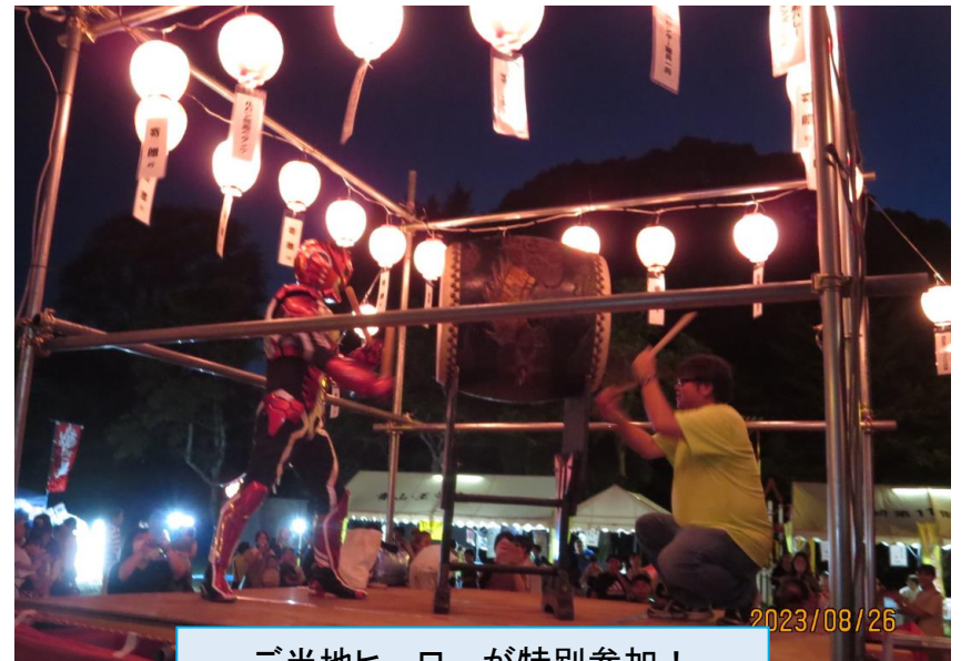
ご当地ヒーローが特別参加!