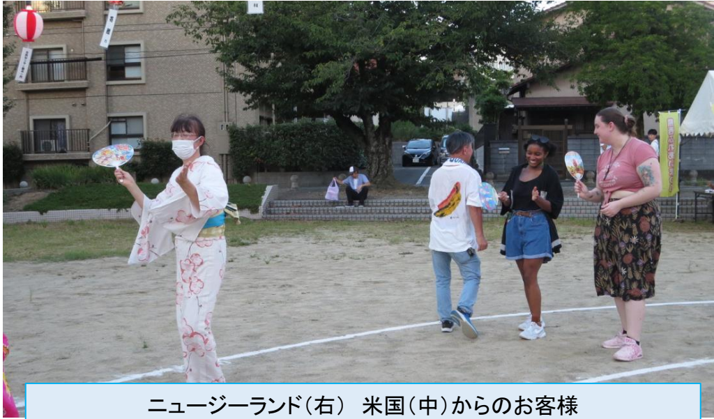
ニュージーランド(右) 米国(中)からのお客様