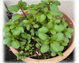
ラベンダーミント