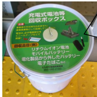
充電式電池等の回収ボックス

投入口（25cm×8.5cm）に入るサイズの小型電子機器（ノートパソコン、小型ゲーム機、電動シェーバー、デジカメ、ビデオカメラ、ワイヤレスイヤホン等）と付属品（電子機器の付属コード類）が廃棄できます。※注意：取り出せる電池は外して電池回収ボックスにお持ちください。