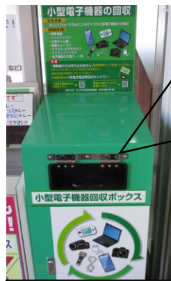
小型電子機器の回収ボックス

4月から小型電子機器と充電式電池等の回収を始めました。注意事項を確認して不要な小型電子機器と電池等のリサイクルにご協力ください。