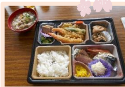
<花見弁当・具だくさんの豚汁>