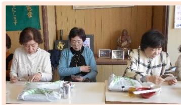
<ビンゴゲームで盛り上がる>

会場では、参加者同士が語り合い、笑い合う、心温まる時間が広がっていました。シニアの皆さんのいきいきとした表情に、年齢を重ねたからこそ生まれる、のどかで豊かなひととき、そして「まだまだこれから」という力強さを感じました。この時間をつくるために、準備を重ねられたスタッフの皆さんの思いが、会場の雰囲気となり、参加者の笑顔へとしっかりと伝わっていました。